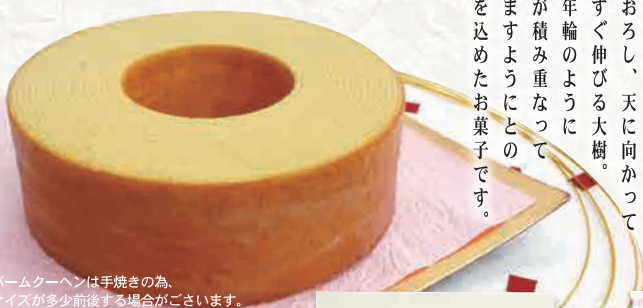
※バウムクーヘンは手焼きの為、 サイズが多少前後する場合がございます。

結婚内祝・出産内祝・入学内祝などにおすすめ！ お日持ちがするので遠方の方への贈り物にも最適